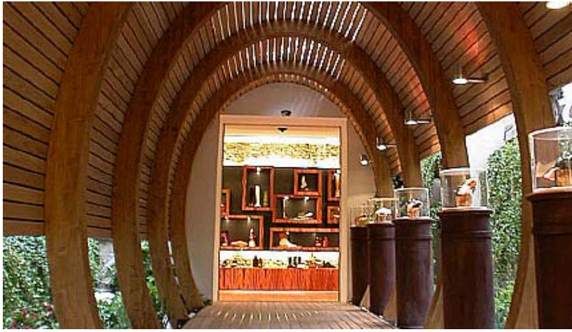
Diesel Flagship Store Milano